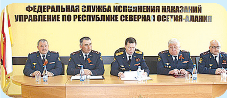
ФЕДЕРАЛЬНАЯ СЛУЖБА ИСПОЛНЕНИЯ НАКАЗАНИЙ УПРАВЛЕНИЕ ПО РЕСПУБЛИКЕ СЕВЕРНАЯ ОСЕТИЯ-АЛАНИЯ

В актовом зале УФСИН России по РСО-Алания прошло заседание коллегии, посвященное подведению итогов работы ведомства за I квартал 2018 г.