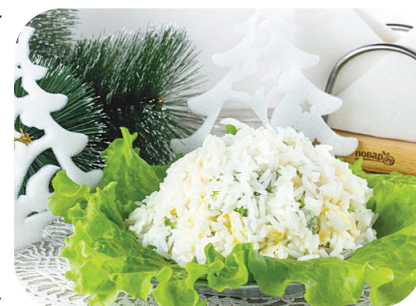
Рис и креветки отварите заранее. Или возьмите уже готовые креветки в рассоле. Листья салата помойте, обсушите и нарежьте. Сыр натрите на крупной терке. Немного риса отложите для украшения салата, а остальные составляющие соедините в миске: рис, креветки, кукурузу, сыр и листья салата. Добавьте по вкусу майонез, при необходимости посолите по вкусу. На блюде выложите листья салата. В виде холмика выложите салат и посыпьте нашим первым снегом - рисом!