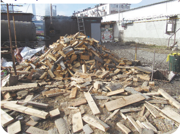
Базарный двор (хинкальный цех) по ул. Строителей с. Михайловского

Учитывая озабоченность руководства АМС МО Пригородный район санитарным состоянием населенных пунктов, районный "Ныхас" (его комитет по благоустройству и санитарному состоянию) организовал рейды по селам.