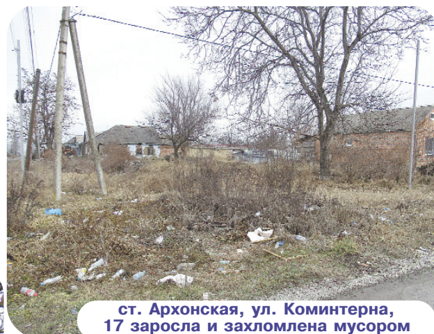
ст. Архонская, ул. Коминтерна, 17 заросла и захломлена мусором

Самыми загрязненными являются обочины старой дороги, идущей от санаторной школы-интерната, а затем и кладбища в сторону г. Владикавказа. Здесь образовалась несанкционированная свалка. Местная администрация не может справиться с этой проблемой.