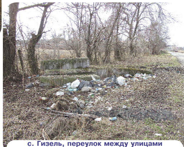
с. Гизель, переулок между улицами А. Коцоева и П. Барбашова

В с. В. Саниба по сравнению с предыдущими годами стало заметно чище. На улицах и окраинах не увидишь ни одного захламленного участка, ухожено и кладбище.