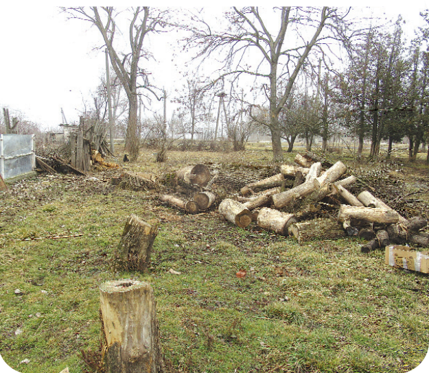
с. Алханчурт, сквер (парковая зона)

для руководства администрации сельского поселения ст. Архонской является развалившийся дом по ул. Ворошилова, 25, который трудно увидеть из-за густых зарослей, растущих здесь в течение многих лет.