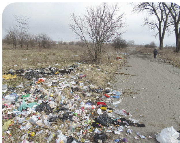
с. Гизель, дорога от санаторной школы-интернат и кладбища в сторону г. Владикавказа