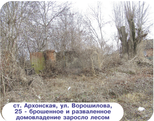
ст. Архонская, ул. Ворошилова, 25 - брошенное и разваленное домовладение заросло лесом