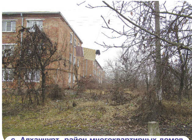
с. Алханчурт, район многоквартирных домов

для руководства администрации сельского поселения ст. Архонской является развалившийся дом по ул. Ворошилова, 25, который трудно увидеть из-за густых зарослей, растущих здесь в течение многих лет.