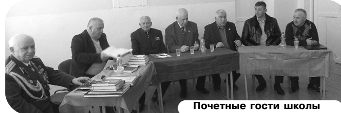
Почетные гости школы