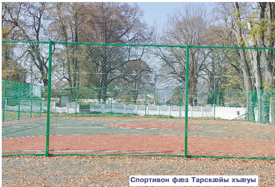
Спортивон фæз Тарскæйы хъæуы

Уыдонæй иу у Тарскæйы хъæуы спортивон фæз. Хъæуы фæсивæд арæх дзырдтой ацы фарстайыл, ома, спортивон æгъдауæй сæ рæстæг кæм æрвитой, ахæм бынат сын нæй, зæгъгæ. Ныр рæхджы - ацы фæзуат куы сырæза, уæд сын фадат уыдзæн спорты хуызты фылдæр архайынæн.