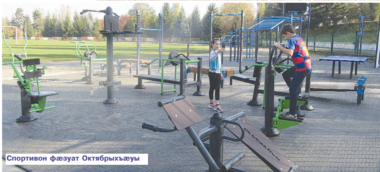
Спортивон фæзуат Октябрхъæуы

Ног спортивон фæзуат кæронмæ арæст фæцис Октябрхъæуы дæр, стадионы цур. Уый сæрмагондæй нысангонд у æппæтуæрæсе-