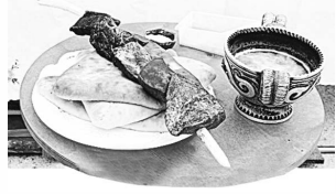
Бæрæгбон хорзæх уæ уæд!

Ирыстоны церæг æппæт дзыллетæ кад æмæ радимæ бæрæг кæнындæй Джоргубайы, Уастырджийы бонтæ æмæ сæ хорздзинадæй хайджын уæнт! Хуыздæр ахъаз, æххуыс кæмæн бакæной, уыдоны æмбал уæнт, чи сын табу кæны, уыцы адæм! Фæззыгон бæркадджын бæрæгбон у, нæ ирон адæм сæйрагæй нысан кæнындæй, æмæ сын æххуысгæнæг уæд! Кæстæртты Уастырджийыл фæдзæхсæм, æмæ сæ царды раст фæндагыл кæнæд размæ. Нæ Иры бæстæ та кæстæртты макуы уæд! Нæ районы æппæт цардджытæ! Фарн æмæ цин уæд уæ хæдзæртты; цæмæ, бæллут, Уастырджийæ хорзсæй чи курут, уыдон уыл серцеуæнт! Бæрæгбон хорзæх уæ уæд!