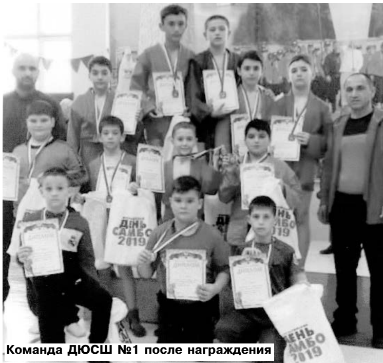
Команда ДЮСШ №1 после награждения

В г. Беслане прошло первенство РСО-А по борьбе самбо среди юношей 2007-2008 гг.р., посвященное Всероссийскому Дню данного вида спорта.