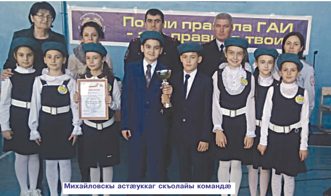
Михайловскы астæуккаг скъолайы командæ