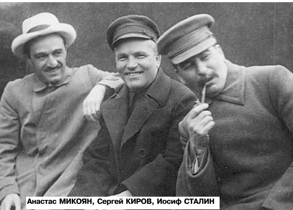
Анастас МИКОЯН, Сергей КИРОВ, Иосиф СТАЛИН

"Все то, чем богат сейчас Азербайджан, все то, что является приманкой для всех западно-европейских стран, прежде всего наши нефтяные промыслы, - над всем этим должен быть поставлен рабоче-крестьянский советский коммунистический знак", - считал Киров. И слова с делом у него не расходились. Подробности об этом можно узнать из уникальной книги "Сергей Миронович Киров в борьбе за нефть", написанной Лаврентием Берией, которая имеется в фонде Президентской библиотеки. Издание вышло в 1936 г., где в предисловии сказано: "Настоящая книга, посвященная памяти Сергея Мироновича, год назад вырванного из наших рядов презренной рукой гнусного убийцы - последыша троцкистско-зиновьевской контрреволюционной группы, охватывает как раз период его работы в Баку, его борьбы в области восстановления и реконструкции Азербайджанской нефтяной промышленности".