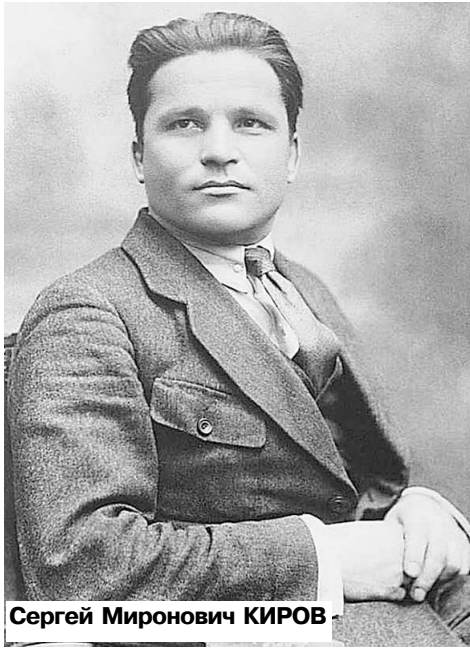
Сергей Миронович КИРОВ

"Части XI армии спешат поделиться с вами революционной радостью по случаю полной ликвидации белого астраханского казачества. <...> Оно получило задачу запереть великую советскую реку и взять Астрахань. Нужно было положить раз и навсегда предел такой дерзости, и ныне это выполнено" - телеграфировал В. И. Ленину