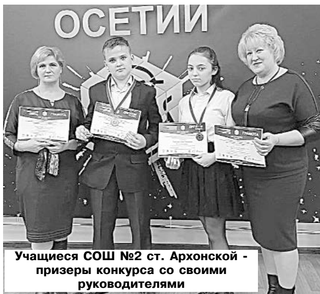
Учащиеся СОШ №2 ст. Архонской - призеры конкурса со своими руководителями

Учащиеся и педагоги образовательных учреждений Пригородного района ежегодно принимают активное участие в данном научно-исследовательском конкурсе, занимая призовые места. В т. г. нем приняли участие обучающиеся учреждения дополнительного образования района - Станция юных натуралистов, учащиеся СОШ №1 и №2 ст.Архонской, СОШ №2 с. Гизель и СОШ с. Ир.