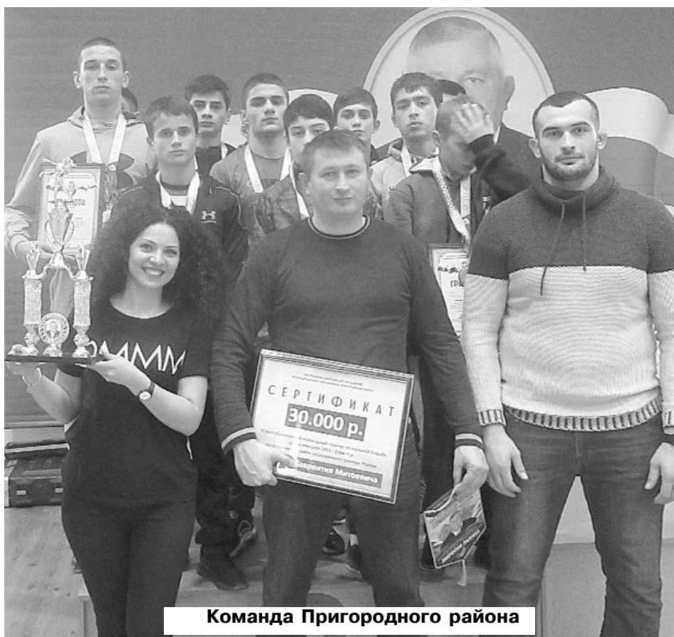
Команда Пригородного района

Победители и призеры были награждены кубками, медалями, дипломами соответствующих степеней и денежными вознаграждениями от руководства Пригородного района.