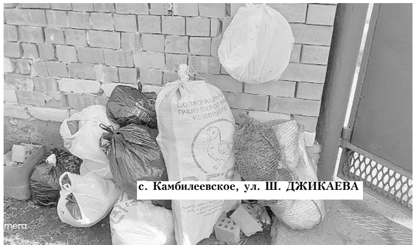
с. Камбилеевское, ул. Ш. ДЖИКАЕВА

Уважаемые жители района! Проблема мусора стала у нас "притчей во языцех". К сожалению, нынешний регоператор ВМБУ "Спецэкосервис" не исполняет свои обязанности в полной мере: села продолжают утопать в мусоре. И это - несмотря на недавнее