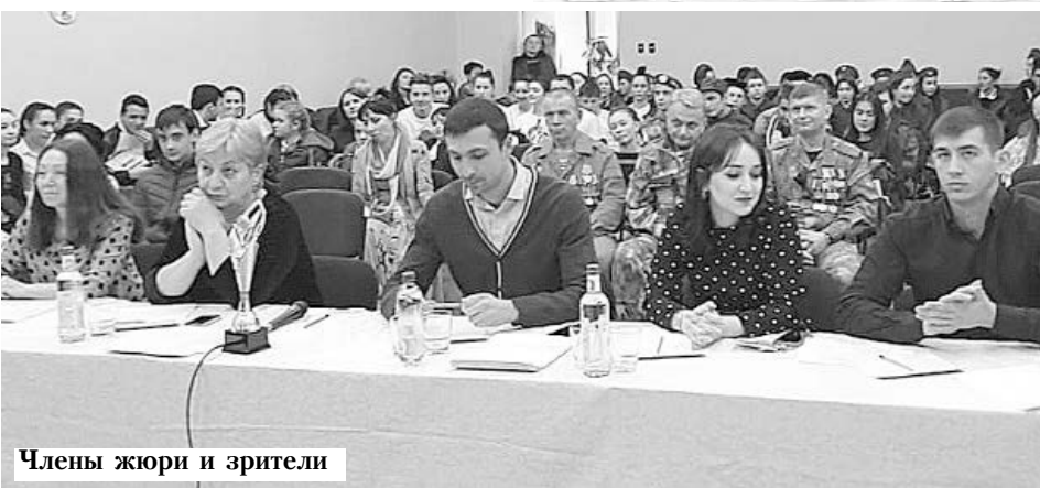
Члены жюри и зрители