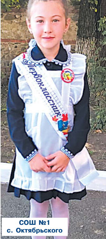
СОШ №1 с. Октябрьского