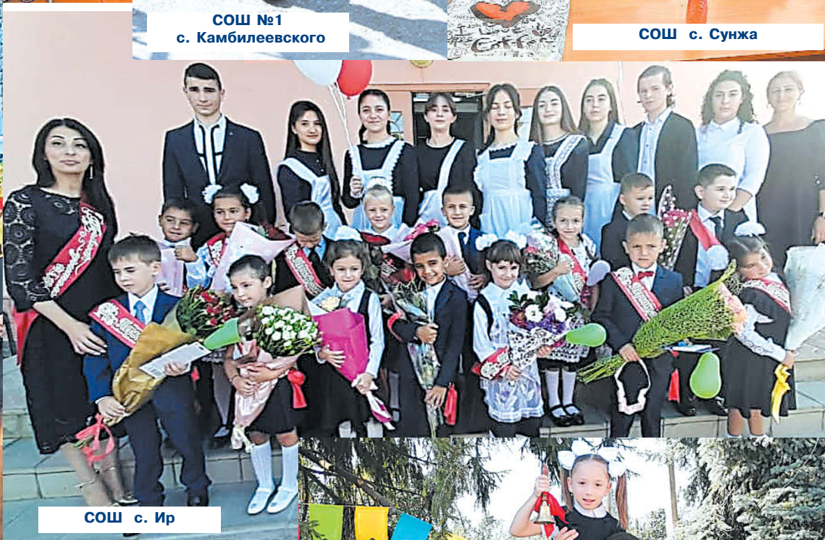
СОШ с. Ир