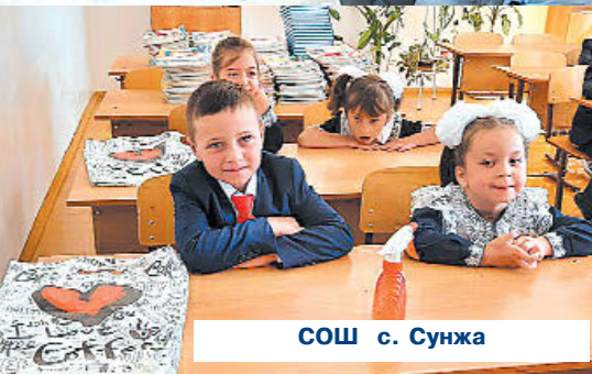
СОШ с. Сунжа