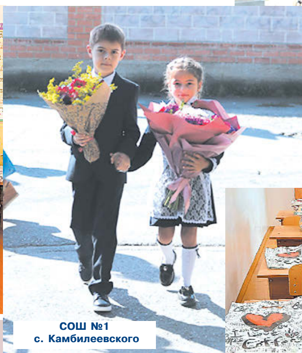
СОШ №1 с. Камбилеевского