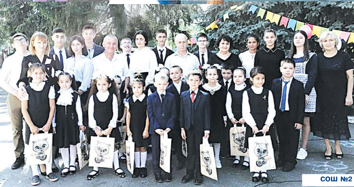
СОШ №2 с. Гизель