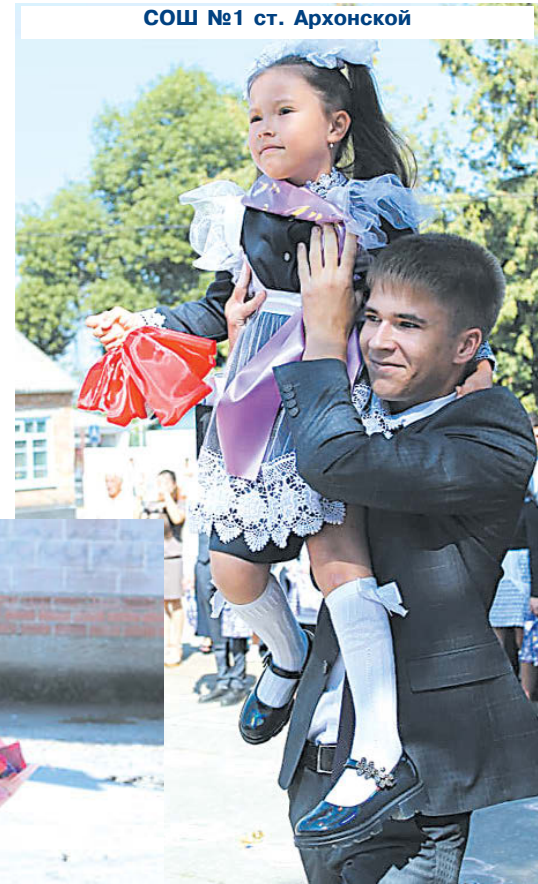
СОШ №1 ст. Архонской

глава муниципального образования Пригородный район.