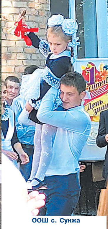
ООШ с. Сунжа