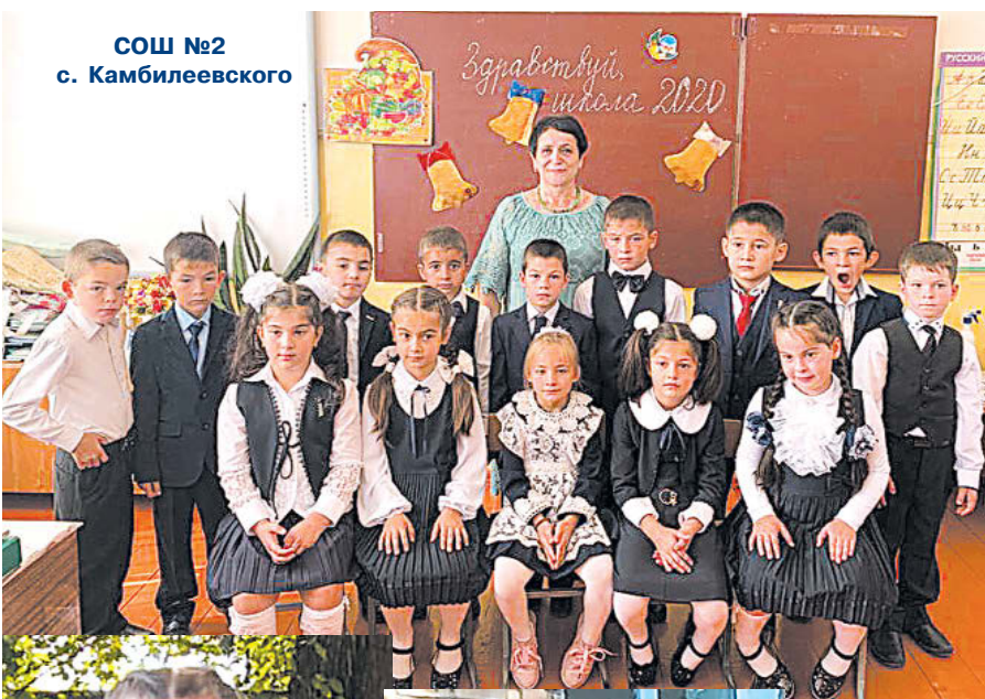
СОШ №2 с. Камбилеевского