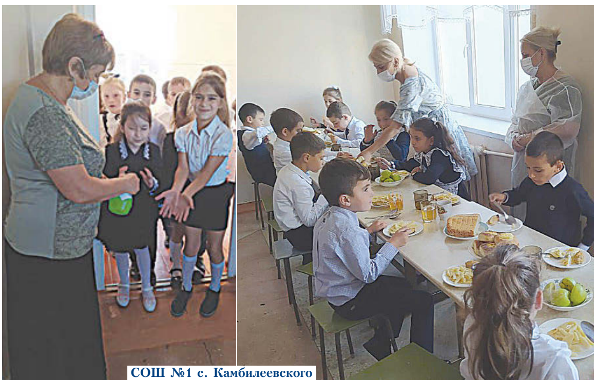
СОШ №1 с. Камбилеевского