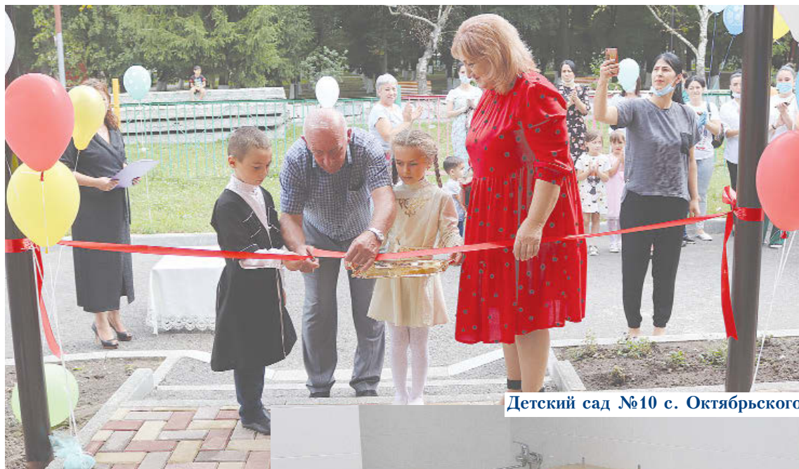
Детский сад №10 с. Октябрьского

Еще одно радостное событие в нашем районе - во вторник в торжественной обстановке открыты две дополнительные ясельные группы в детском саду №10 с. Октябрьского и №12 с. Ногир, каждая из которых рассчитана на 20 мест.