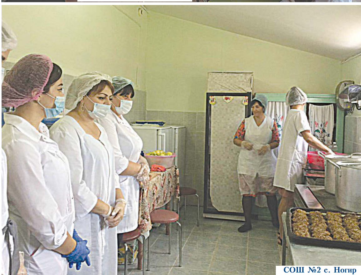
СОШ №2 с. Ногир