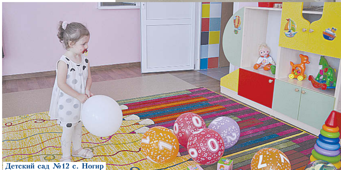
Детский сад №12 с. Ногир

Помещения соответствуют всем требованиям СанПин, пожарной и технической безопасности. Здесь расположены спальная и игровая комнаты, отдельные санузлы для детей и сотрудников, раздаточная комната, методкабинет, оснащенные современным оборудованием, наглядным материалом и игрушками, необходимыми для развития детей ясельного возраста.