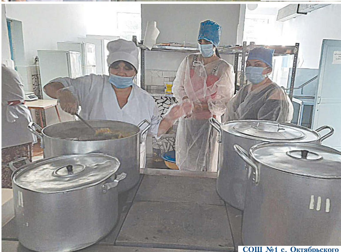
СОШ №1 с. Октябрьского