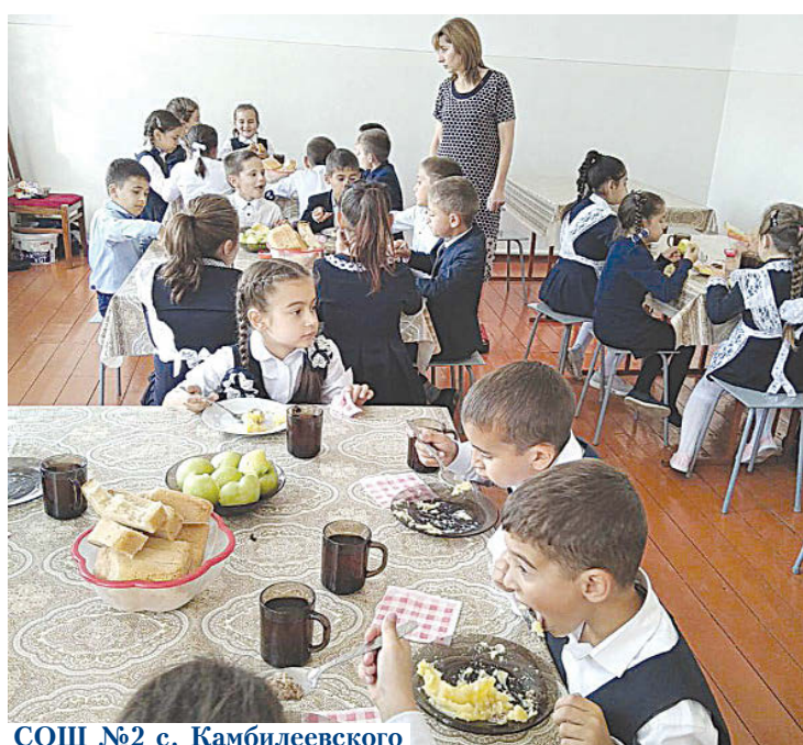
СОШ №2 с. Камбилеевского