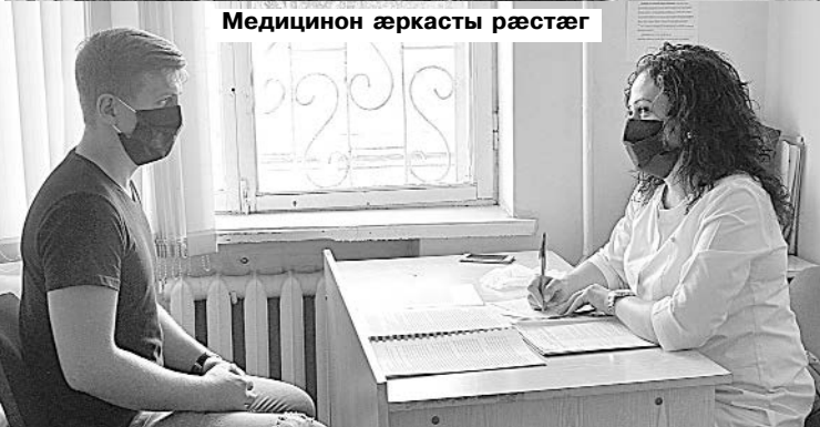
Медицинон æркасты рæстæг

ынц, уымæ гæсгæ цæттæ сты Фыдыбæстон æфсады службæ арвитынмæ, зонынц сæ хæс фыдыуæзæджы раз æмæ цыфæнды уавæрты дæр фæстæ нæ фæлæудзысты. Уый сын фыдæлтæй баззад.