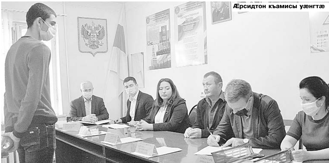
Æрситдон къамисы уæнгтæ

Куыд Уæрæсейы, афтæ Горæтгæрон районы дæр 1 октябры райдыдта æфсады рæнхъытæм фæззыгон æрситдт.