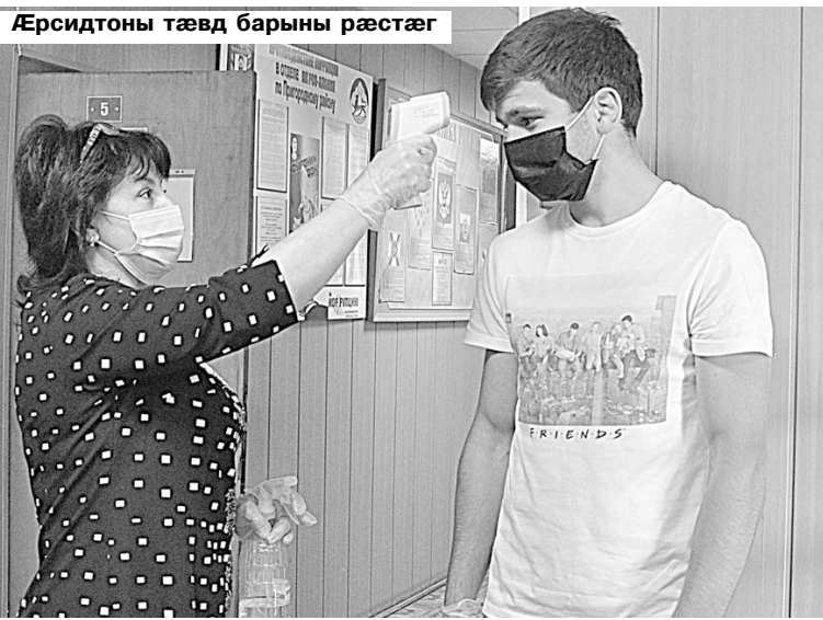
Æрситдонты тæвд барыны рæстæг

ситдонты арвитдзыстæм æфсады рæнхъытæм 14 октябры. Къамис кусы сфидаргонд графикмæ гæсгæ, фембæлдтытæ уадзы æрситдонтимæ. Уыцы куысты графикимæ зонгæ сты хъæуты бынæттон администрацитæ æмæ пæлицæйы хайадон инспектортæ дæр.