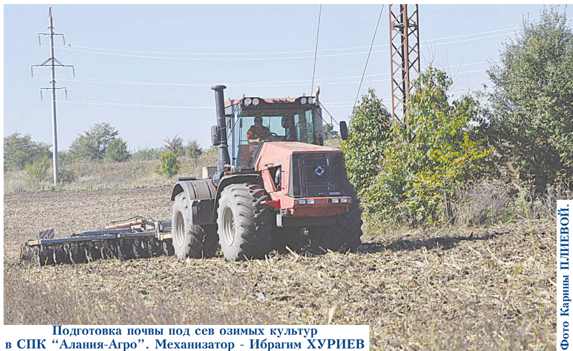
Подготовка почвы под сев озимых культур в СПК "Алания-Агро". Механизатор - Ибрагим ХУРИЕВ

Механизаторы сельхозпредприятий также приступили к подготовительным работам, к осеннему севу колосовых культур.