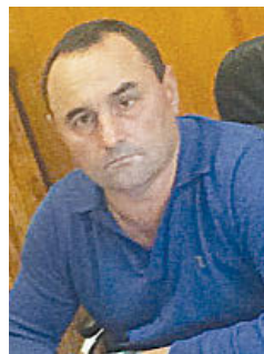
Главы сельских поселений Пригородного района.

Мира и благополучия тебе и каждой семье Тарского сельского поселения!