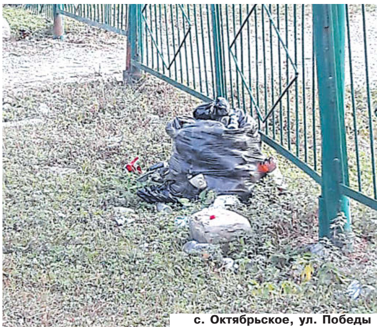
с. Октябрьское, ул. Победы

Уважаемые жители Пригородного района! Не стоит забывать о том, что чисто не там, где убирают, а там, где не сорят!