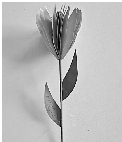
Георгий КОРТИЕВ ("Аленький цветочек")

Все работы были отправлены на Всероссийский конкурс декоративно-прикладного творчества и авторской фотографии "В предчувствии весны", который