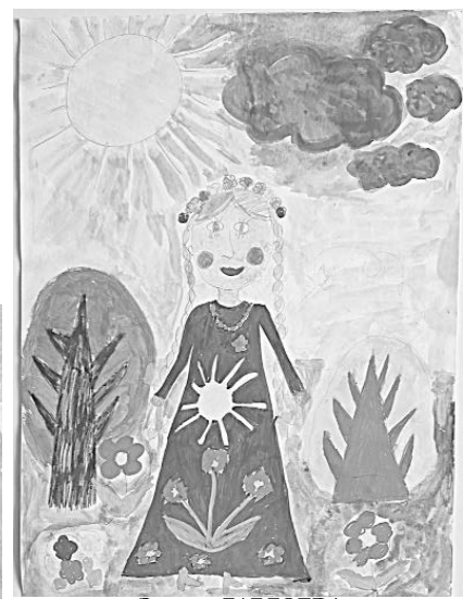
Эмилия ГАГЛОЕВА (работа "Девочка-весна")

Все работы были отправлены на Всероссийский конкурс декоративно-прикладного творчества и авторской фотографии "В предчувствии весны", который