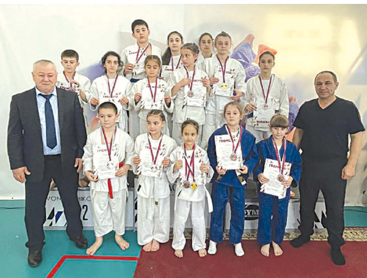
На снимке: победители и призеры из с. Сунжи со своим тренером (первый справа)

В Кабардино-Балкарской Республике прошел открытый межрегиональный турнир по дзюдо среди юношей и девушек 2008-2009-х, 2010-2011-х, 2012-2013-х, 2014-2015-х и 2016-2017-х годов рождения, приуроченный к празднованию 80-летия со Дня Победы в ВОВ.