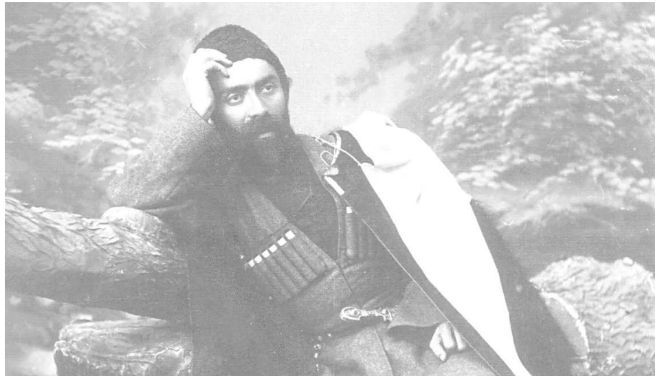
...Ма ууæнд, кæй ферох кодтон Мæ хæхтæ, мæ мæгуыр хъæу, Мæ мæгуыр адæмы, ды ууыл.

Ирыстоны фыццаг поэт Хетæгкаты Къоста йæ адæмы никуы рох кодта. Уый йæ 'ппæт сфæлдыстад, йæ тох, йæ цард дæр уыдонæн снывонд кодта.