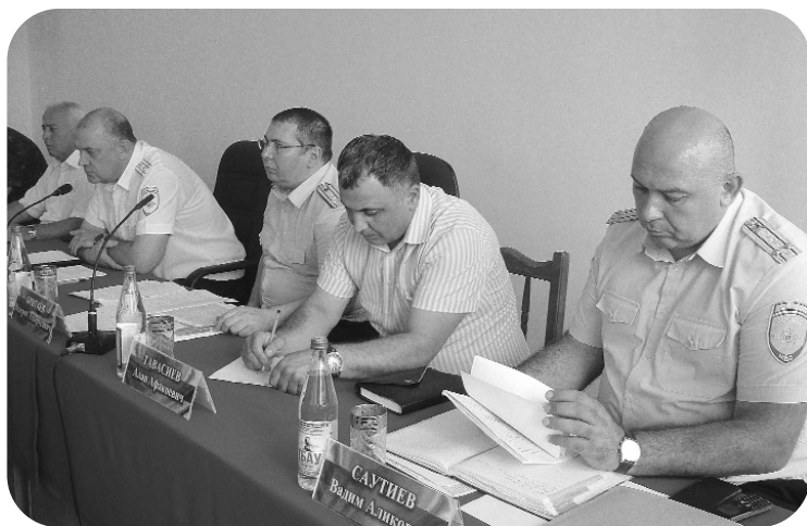
На заседании под председательством заместителя министра внутренних дел по РСО-Алания полковника полиции Дмитрия Гутыря в Отделе МВД России по Пригородному району подведены итоги оперативной служебной деятельности за первое