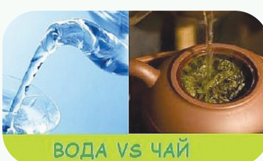
ВОДА VS ЧАЙ

Конечно, воду человек получает из пищи и из различных напитков. Но ни один из них так не полезен организму, как самая простая вода. Правда, лучше не экспериментировать с той, которая льется из-под крана. Обязательно помни о важности фильтрации: фильтры бывают очень разные, но все они очи-