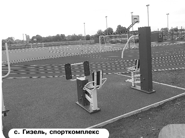
с. Гизель, спорткомплекс

Подъезжая к ст. Архонской со стороны города, где недавно праздновали 180-летний юбилей, в глаза бросается ухоженность огороженного "холма памяти" с крестом. А с правой стороны, рядом с кладбищем (не доезжая до АЗС) огоро-