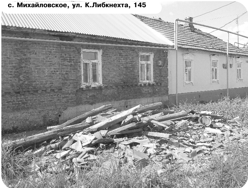
с. Михайловское, ул. К.Либкнехта, 145