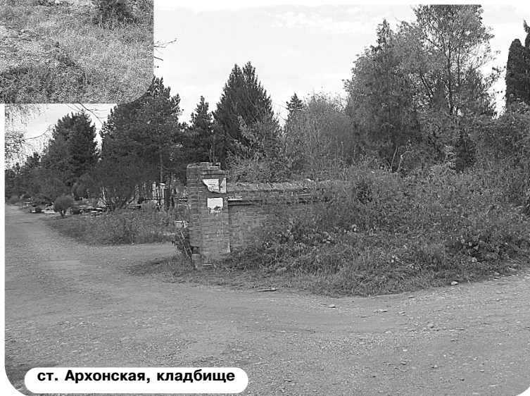
ст. Архонская, кладбище

В последнее время в селе появилась еще одна достопримечательность. На северной окраине села построен спортивный комплекс: стадион, спортивная площадка для игры в мини-