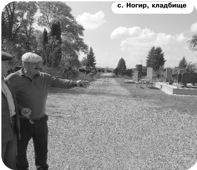
с. Ногир, кладбище