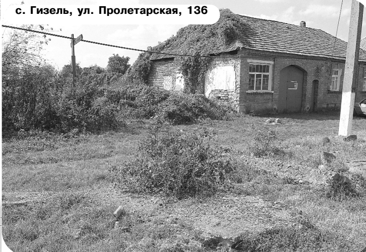
с. Гизель, ул. Пролетарская, 136

женный участок зарос бурьяном и кустарником, в неприглядном виде само кладбище. Наверное, руководство станицы решило, что за забором никто этой невзрачной картины не увидит.