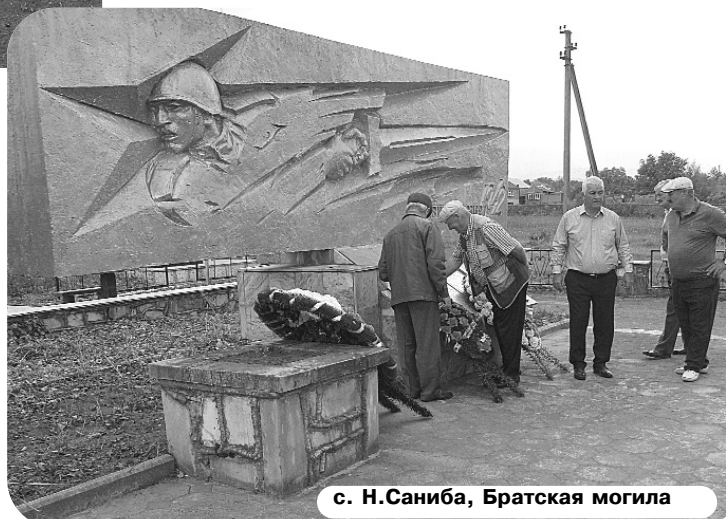
с. Н.Саниба, Братская могила

Сравнительно чище стало и на улицах с. Гизель, особенно напротив здания местной администрации, где проживали вынужденные переселенцы. После того,