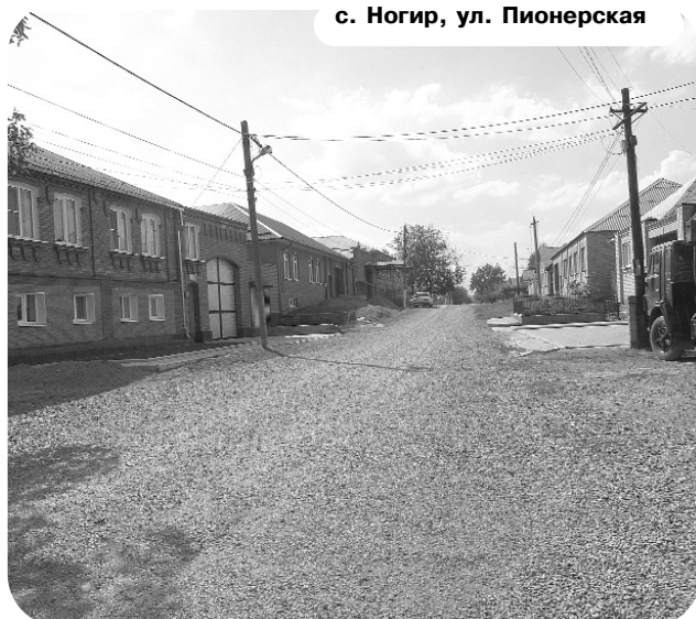
с. Ногир, ул. Пионерская

как последних вынудили уйти, на этой территории ни осталось никаких пристроек. Данная площадь выровнена и очищена от всякого хлама. Теперь здесь, по словам главы местной администрации А. Доева, будет строиться Дом культуры, и еще здесь же разобьют сквер.