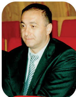
Депутат Верховного Совета СССР от Пригородной комсомольской организации