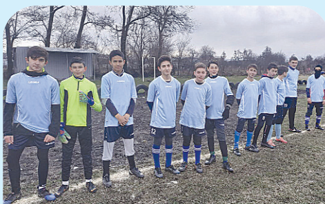
Команда "Сармат" с. Гизель - 2004 г.р.

Участники соревнований были награждены медалями, дипломами, грамотами и личными призами. Лучшими