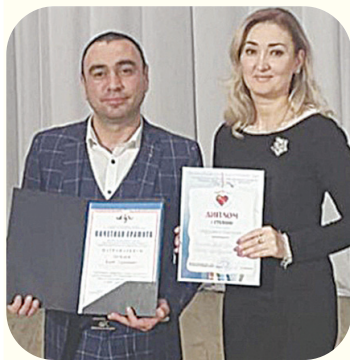
Недавно в республике в течение трех дней проходил очередной XVI республиканский конкурс

профессионального мастерства работников сферы дополнительного образования "Сердце отдаю детям", организованный Министерством образования и науки РСО-А.