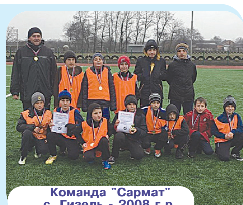
Команда "Сармат" с. Гизель - 2008 г.р.